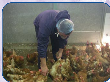
Surveillance-contrôle en salle d'élevage.