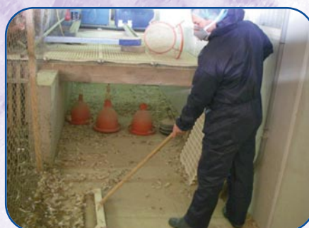
Entretien bâtiment et matériel.