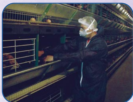
Ramassage des animaux morts.