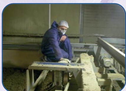
Interventions ponctuelles sur le séchage des fientes.