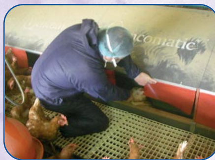
Eloignement des poules, tri couveuse.