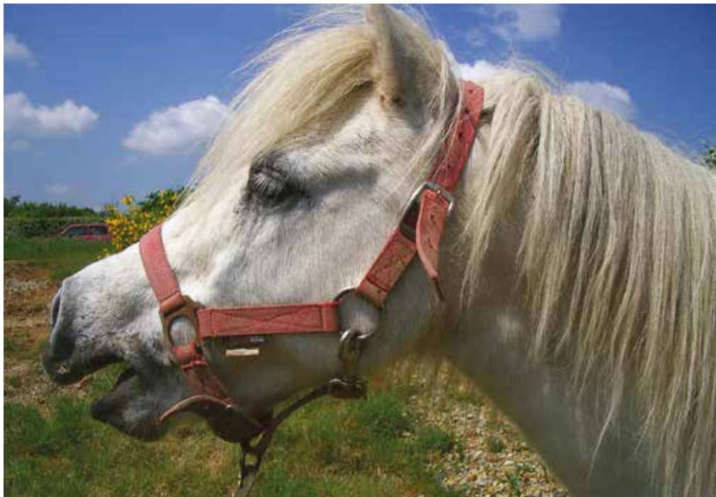
Un cheval qui hennit.

Les signaux émis par le cheval par le biais de sa posture, la position de ses oreilles et de