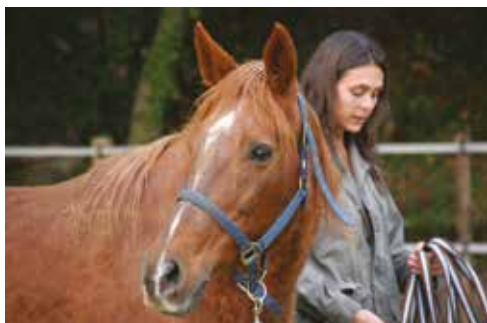
L'inattention de l'homme et du cheval l'un envers l'autre est source d'accident.

L'éducation du cheval demande de l'attention : le cheval n'obéira que s'il perçoit une attention chez la personne avec qui il interagit !