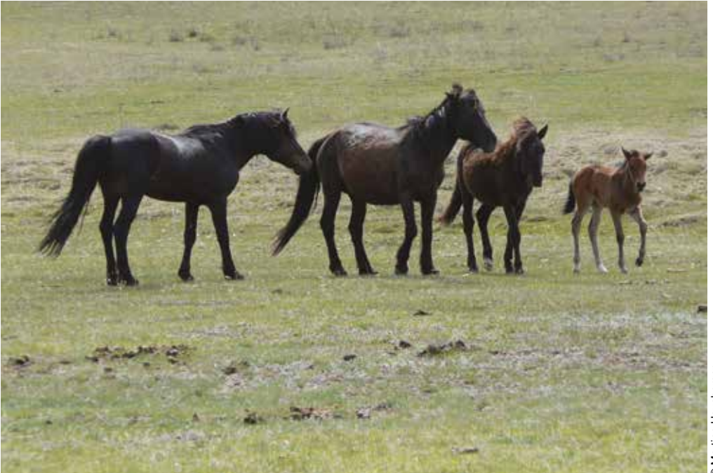
Une famille de chevaux en milieu naturel.

(moins visible), dont le but est d'éviter les conflits. Les animaux dominants ont un accès privilégié à une ressource donnée quand elle est restreinte. Le statut de chacun étant connu, des signaux subtils (position des oreilles par exemple) suffisent pour éviter les conflits. Un cheval peut être dominant pour certaines ressources et pas d'autres ; il peut être « dominant » dans un groupe et « dominé » dans un autre.