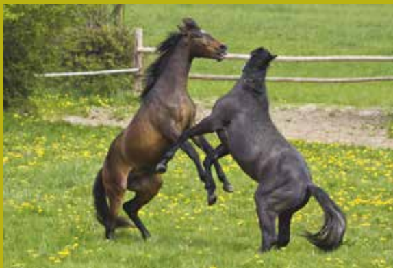
Des chevaux qui jouent.