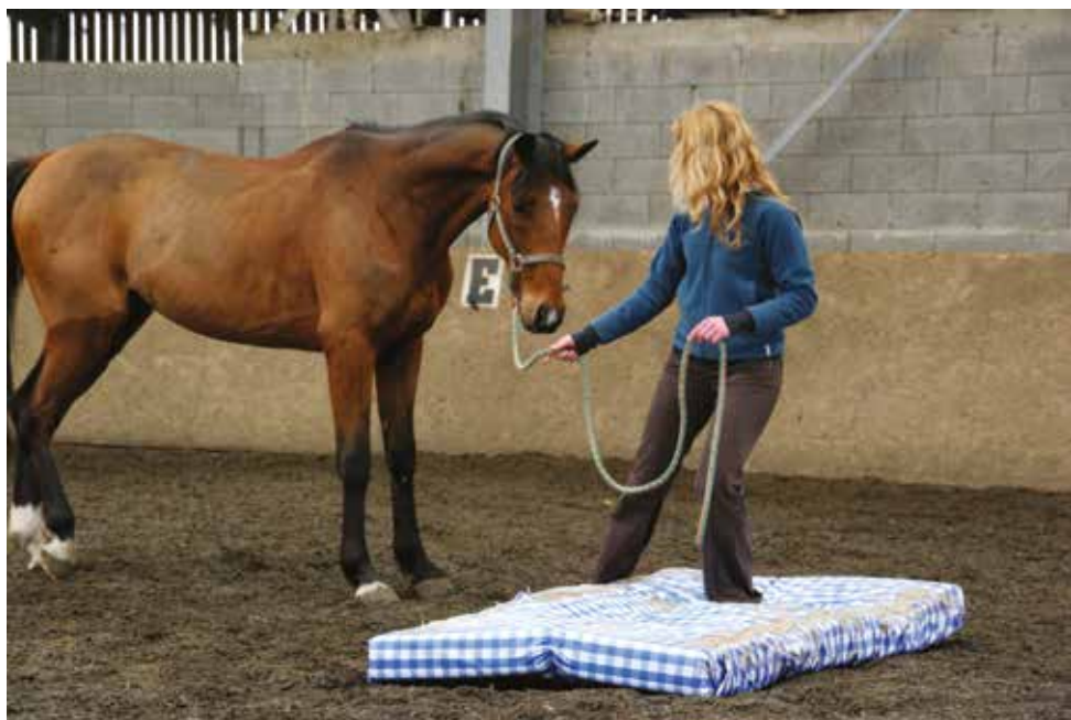
Les chevaux n'ont pas tous le même « caractère ». Ils sont plus ou moins peureux.

En milieu domestique, tous savent que les chevaux n'ont pas tous le même « caractère ». Ils sont plus ou moins effrayés par des stimuli de l'environnement, sont plus ou moins difficiles à séparer des autres, apprennent plus ou moins bien et sont plus ou moins proches de l'homme. Cependant ces différences ne sont visibles qu'en conditions susceptibles d'induire des réactions (séparation des autres par exemple).