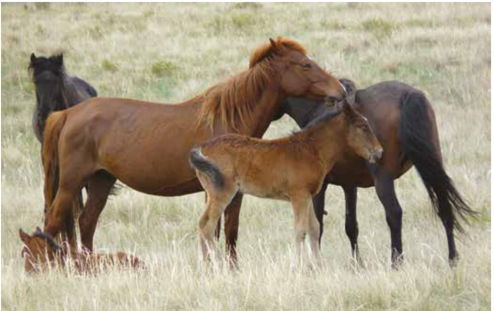
Des poulains en milieu naturel.

En conditions domestiques, il y a souvent des interventions humaines autour de la naissance et le sevrage se fait de manière précoce, s'accompagne d'une séparation de la mère, voire d'isolement. Le stress de séparation du poulain est très visible. Après sevrage les jeunes sont gardés en groupes de même sexe, même âge ce qui restreint leurs expériences sociales.