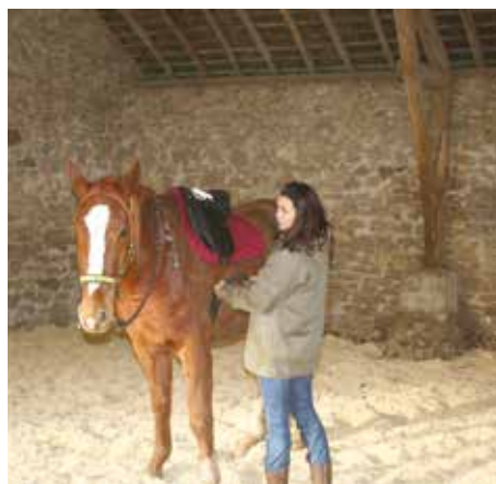
Pour mieux apprendre, il faut privilégier les endroits calmes sans stimulations externes.