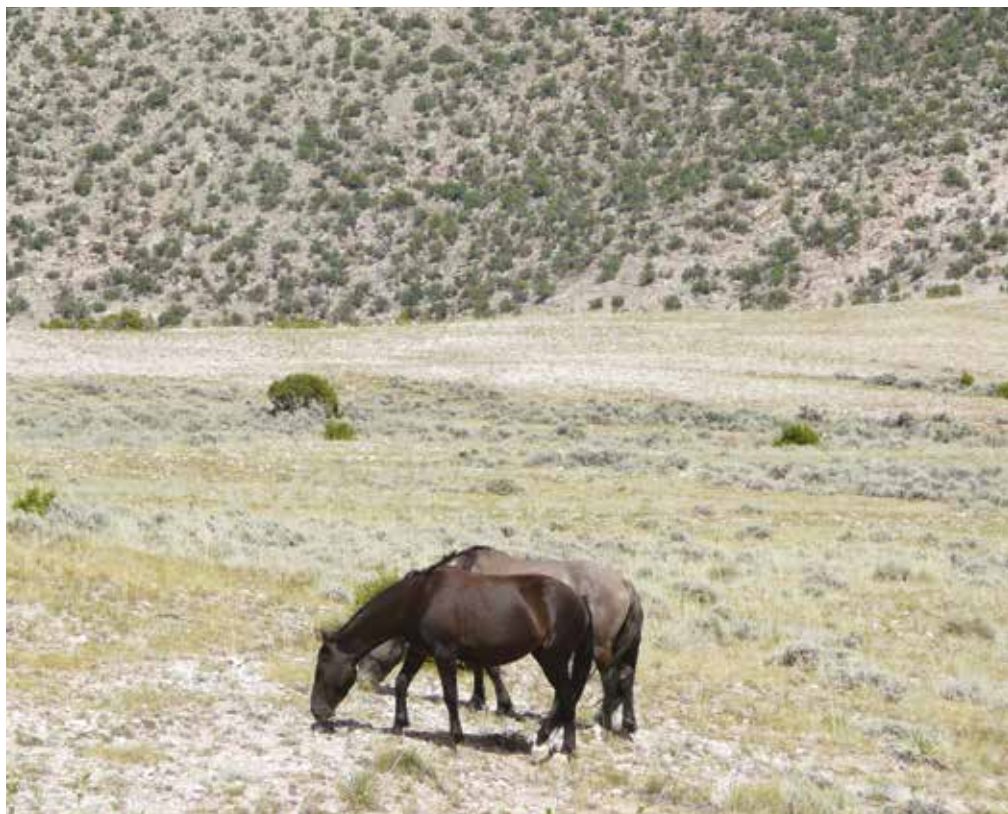
En milieu naturel, le cheval vit essentiellement dans des zones où l'alimentation est « pauvre »