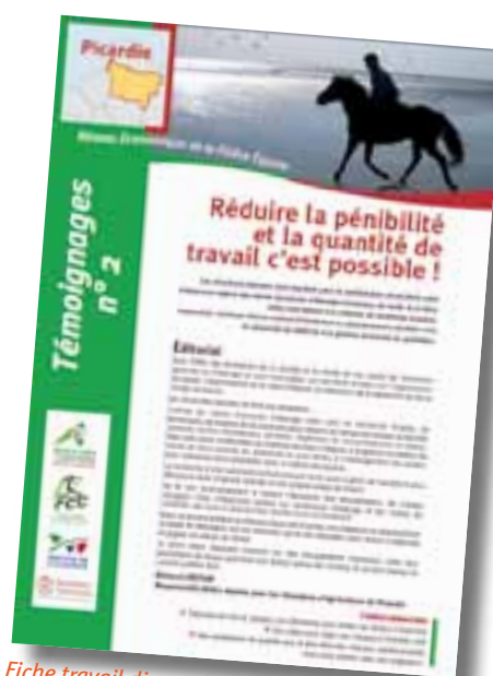
Fiche travail disponible sur le site des Haras Nationaux